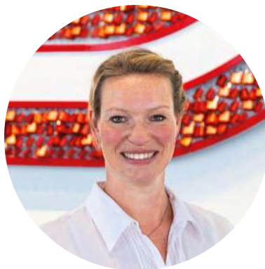
KATHRIN EHLER PM Digitales Lernen